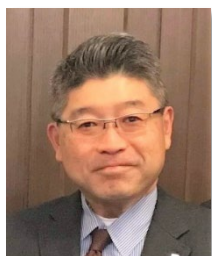
サッポロビール株式会社 人事部 プランニング・ディレクター